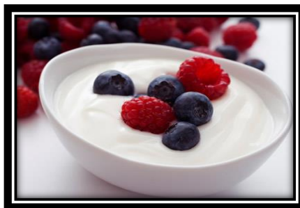
Gambar 12.1 Yogurt

Yogurt merupakan minuman hasil fermentasi susu yang menggunakan bakteri Streptococcus thermophilus atau Lactobacillus bulgaricus . Bakteri ini akan mengubah laktosa pada susu menjadi asam laktat. Efek lain dari proses fermentasi adalah pecahnya protein pada susu yang menyebabkan susu menjadi kental. Hasil akhirnya susu akan terasa asam dan kental. Proses penguraian ini disebut fermentasi asam laktat dan hasil akhirnya dinamakan.