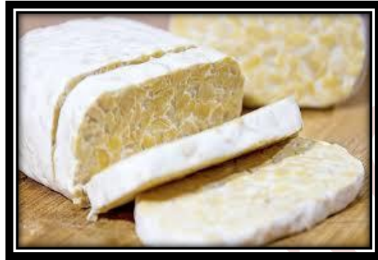
Gambar 12.5 Tempe

jamur, jamur juga akan membuat suatu enzim protease yang dapat menguraikan protein kompleks yang ada pada kedelai menjadi asam amino yang lebih mudah dicerna oleh tubuh kita.