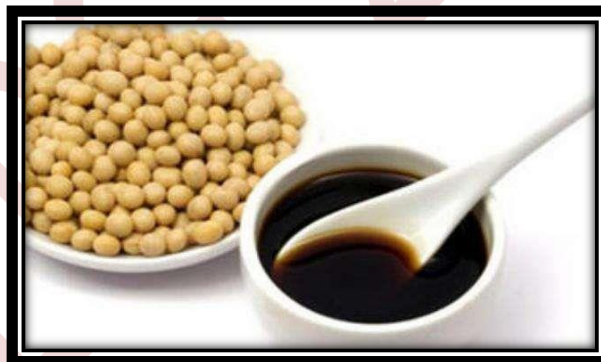
Gambar 12.4 Kecap

Kecap merupakan salah satu produk hasil bioteknologi yang terbuat dari kacang kedelai. Pada tahap awal kedelai akan difermentasi dengan menggunakan jamur Aspergillus wentii . Tahap selanjutnya kedelai yang sudah difermentasikan akan dikeringkan dan direndam di dalam larutan garam. Pembuatan kecap dilakukan melalui proses perendaman kedelai dengan larutan garam, sehingga pembuatan kecap dinamakan fermentasi garam. Jamur Aspergillus wentii akan merombak protein menjadi asam-asam amino, komponen rasa, asam, dan aroma khas.