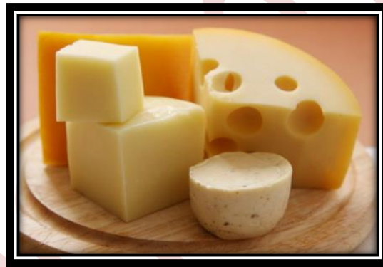
Gambar 12.2 Keju

Selanjutnya enzim renin akan mengubah gula laktosa dalam susu menjadi asam dan protein yang ada pada dadih. Dadih inilah yang akan diproses lebih lanjut melalui proses pematangan dan pengemasan sehingga terbentuk olahan makanan yang dikenal dengan keju.