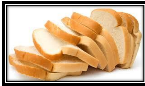
Gambar 12.3 Roti