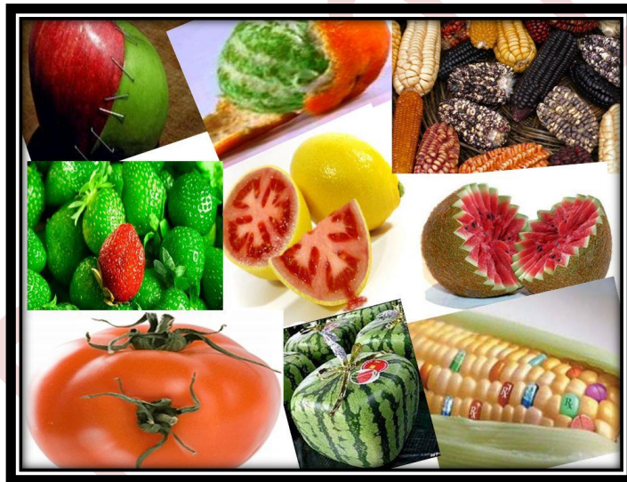
Gambar 12.6 Contoh-contoh tanaman transgenik

Tanaman transgenik adalah tanaman yang telah mengalami perubahan susunan informasi genetik dalam tubuhnya. Tanaman transgenik ini merupakan suatu alternatif agar tanaman tahan terhadap hama sehingga hasil panen dapat melimpah. Bahkan, tanaman juga dapat direkayasa agar mampu membunuh hama yang menyerang tumbuhan tersebut. Untuk membuat suatu tanaman transgenik, pertama-tama dilakukan identifikasi atau pencarian gen yang akan menghasilkan sifat tertentu (sifat yang diinginkan).